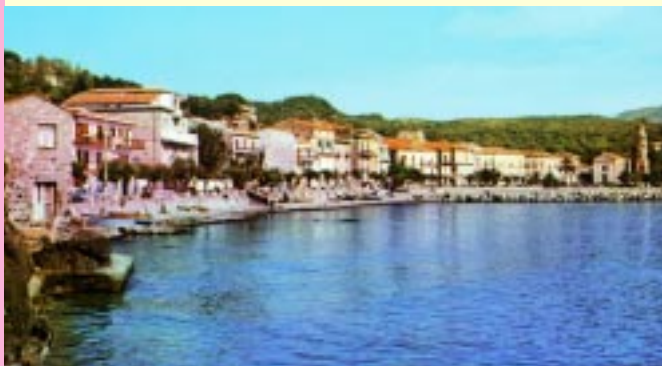
Scorcio panoramico di Scario, una delle località di mare più ambite dai turisti

ed opportunistico iacere , con cui letteralmente i patroni del terzo millennio gettano nella sportula cibi e denaro ai clienti di turno. Qualche gesuita definirebbe forse tutto questo neomachiavellismo, ma il pensiero di Machiavelli la sua etica l'aveva, proprio perché era pensiero e si rivolgeva ad "animali politici". L'odierna "politica" è "economia" da bottega, non di polis: bottega e polis sono accomunate, per così dire, dall'angustia