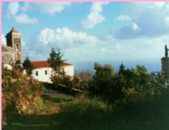
Sulla destra il discusso monumento a San Francesco davanti al convento francescano di Pollica

Di recente sono stato in Austria con amici (scrivo questo per far notare la differenza di mentalità) e la guida ci