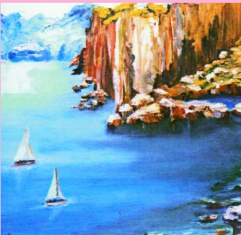
Scogliere cilentane - olio 50x70 della pittrice Rosanna Esposito