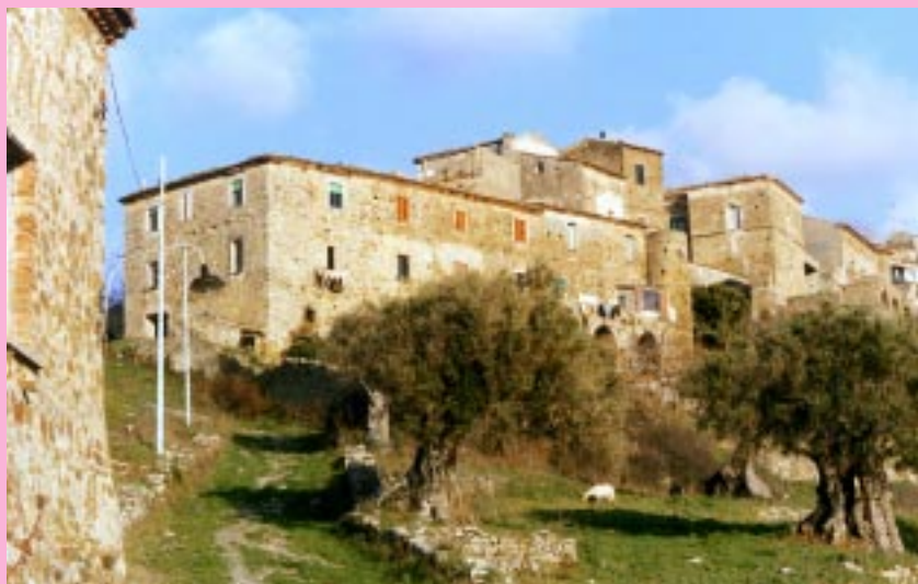
Scorcio panoramico della frazione Galdo Cilento, sede del "Caffé Letterario"

Che costoro non vedano l'inganno nascosto dietro questo sistema, è molto triste per me, ma è preoccupante per il loro futuro: d'altra parte, lì dove si tace e si attende, chi comanda può manovrare e raggiungere tranquillamente i propri obiettivi, sulla qualità dei quali sarebbe bene che i giovani riflettessero.