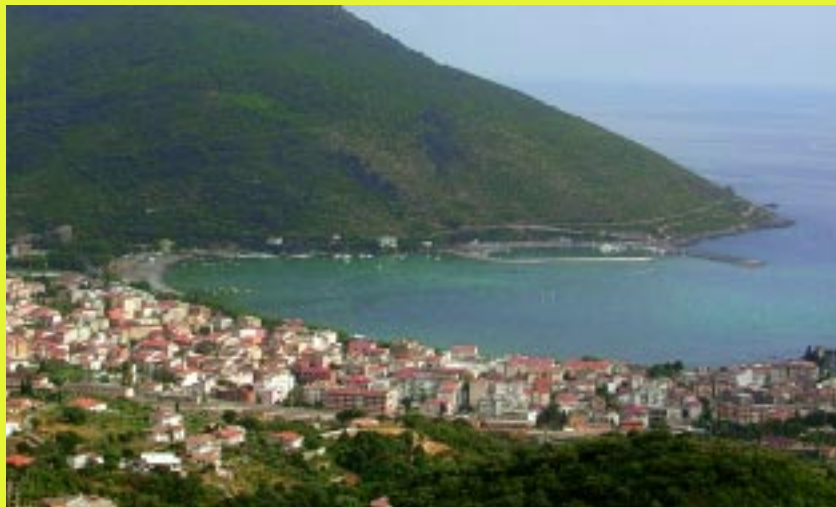
Il golfo di Sapri che, nel progetto, sarà attraversato da un ponte...

Nell'intervista che il redattore dell'articolo faceva al senatore Borea, questi rispondeva: "L'idea è di fare della ss. 18 un percorso alternativo all'autostrada Salerno-Reggio Calabria... Per evitare il problema della strozzatura rappresentata dal golfo di Policastro... è stata progettata una variante marina che presenta un percorso più