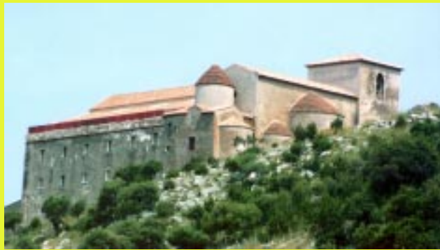
Il Santuario della Madonna del Granato

Nei meriggi tediosi, quando il sole inizia a scendere sull'orizzonte e la luna piano piano diventa padrona del cielo stellato, un desiderio di evadere, specialmente se qualche cupo pensiero attraversa la mia testa, diventa il mio unico padrone, specie se mi 'ordina' di uscire di casa, di salire sulla macchina e di volare verso dove