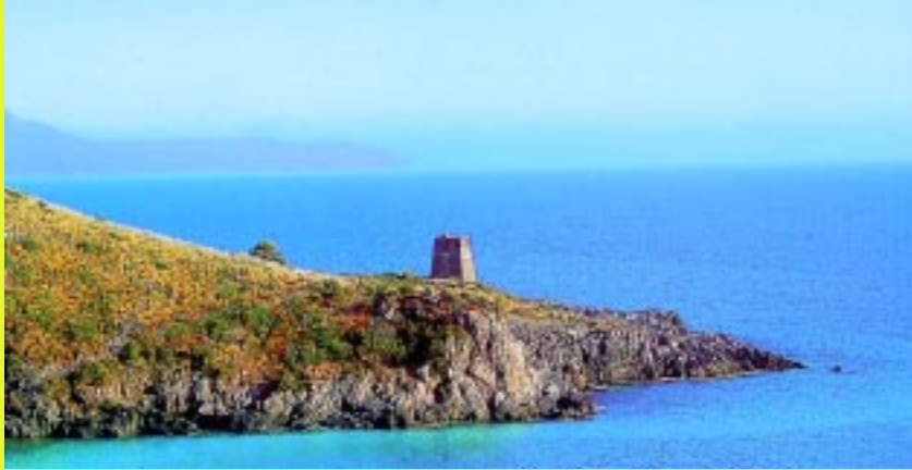
Un tratto della costa cilentana ed un'antica torre di avvistamento