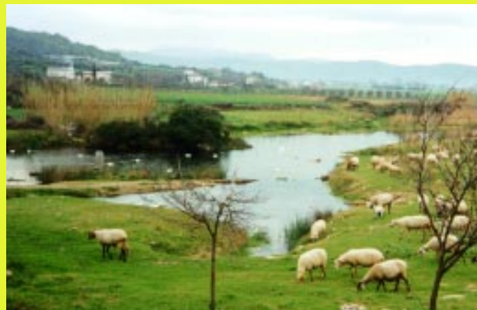
Le storiche sorgenti di Capodifiume, Capaccio-Paestum

Nel suo nome si combattono guerre vere e guerre economiche e i conflitti saranno destinati a dilagare soprattutto a causa delle crescenti privatizzazioni e dei conseguenti giochi di potere che ruotano intorno a tutto ciò che a torto e ragione, è ritenuto un bene universale.