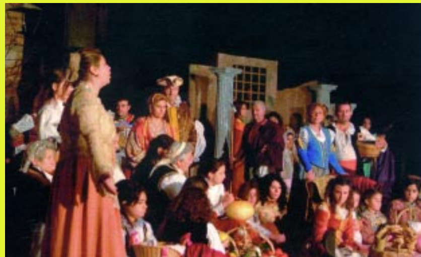
Una scena della suggestiva Rappresentazione

La "sacralità" della Natività è stata presentata in una Napoli settecentesca con i vari figuranti nei caratteristici e pittoreschi costumi dei pastori del presepe napoletano. Il mercato ha preso vita al suono delle tamorre e della vivace tarantella, le voci e i richiami dei venditori hanno riempito la sala portando, immediatamente, gli spettatori nell'atmosfera briosa di un vicolo napoletano: le lavandaie litigiose, il giovane che fa la serenata, il canto dei pescatori e della "fricciarola semmentara", hanno colorato la prima parte dello