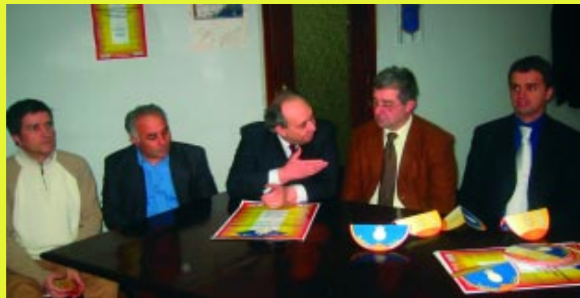
Un momento della conferenza stampa

Si è tenuta a Sala Consilina, presso l'aula consiliare del Palazzo di città, la conferenza stampa di presentazione di "Teatro in Sala", la rassegna nazionale di teatro amatoriale giunta ormai alla decima edizione. Nel corso dell'incontro è stato illustrato il programma della manifestazione che, promossa dalla locale Associazione "I Ragazzi di San Rocco" in collaborazione con il Comune e con la Provincia di Salerno, che aperta il 20 gennaio proseguirà fino al 24 marzo.