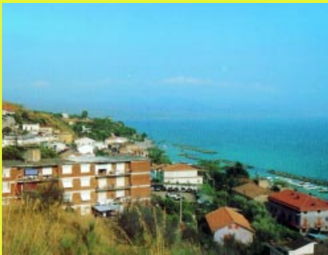
Scorcio panoramico di Pioppi

Sg. Direttore, ho davanti a me il numero 11/2005 di Cronache Cilentane. Leggo con interesse, in prima pagina, il servizio che riporta i finanziamenti da parte della Regione Campania per l'adeguamento o per la costruzione dei porti sulla costa cilentana. A primo acchito ho tirato un sospiro di sollievo pensando: finalmente è arrivata l'occasione per la costruzione del già