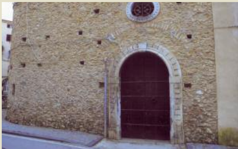
Palazzo Ricci nel centro storico di Ascea

Un nuovo piano comunale (ex piano regolatore) per il futuro di Ascea e frazioni.