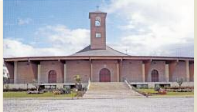
La nuova chiesa S. Maria Assunta in località Licinella di Capaccio