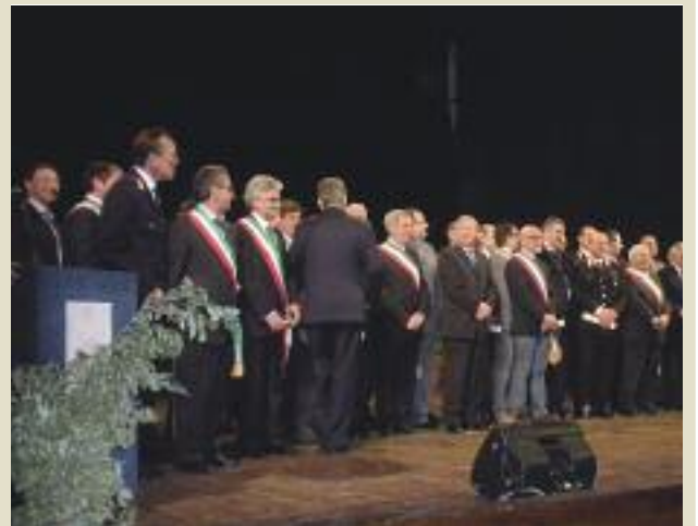
Foto ricordo del gruppo di coloro che hanno ricevuto le onoreficenze al merito.