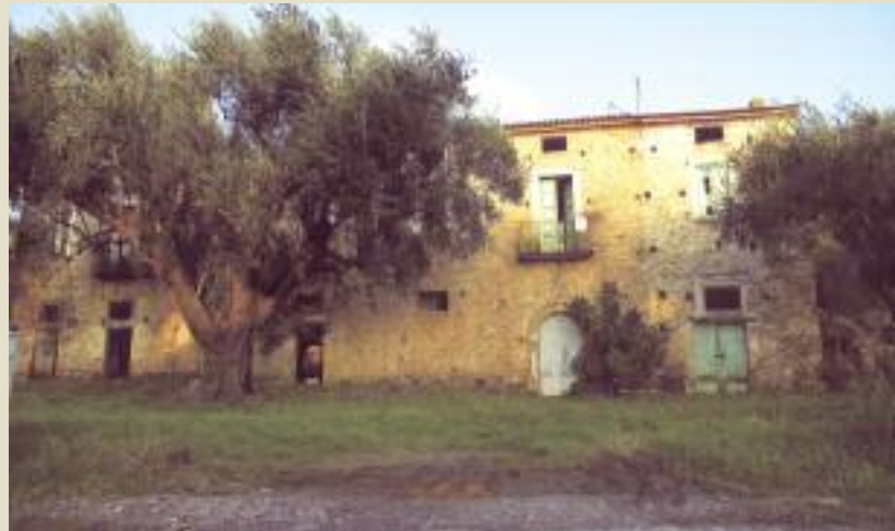
Casa Pisciotano in Marina di Ascea

comunale che riguardano sia il capoluogo che le frazioni, piano che l'amministrazione sta preparando prima della scadenza del vecchio Piano Regolatore.