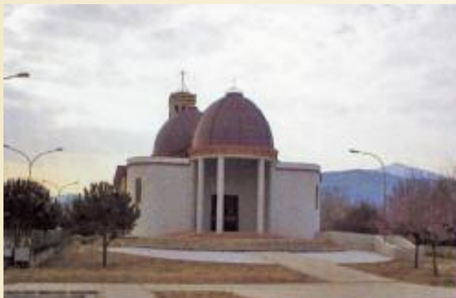
La chiesa della SS. Trinità costruita a Casalvelino Scalo

Sì, Cilento terra di Maria, anche per quanto ci hanno lasciato in eredità i nostri antenati, ai quali va dato il merito di averci trasmesso la