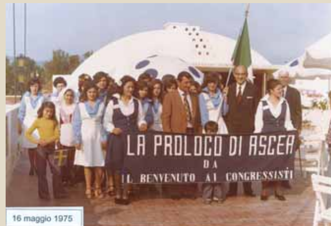
16 maggio 1975