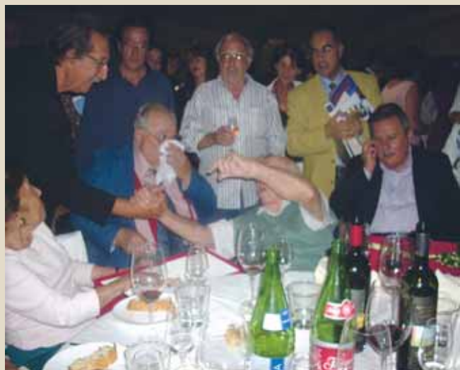
Il brindisi per i 90 anni di Stamler

E proprio a Pioppi, il paese che i coniugi Keys avevano scelto come seconda patria, i componenti del Convegno vogliono ricordarli, a pochi anni dalla loro scomparsa,