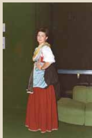
Tipico costume cilentano che è stato esposto in boutiques di Milano e Budapest