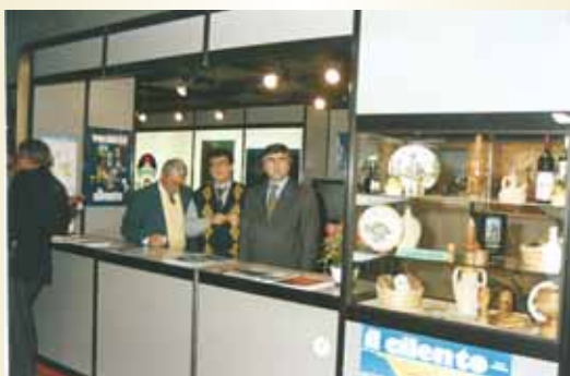
Il Cilento, protagonista alla BIT di Milano

Gli ultimi anni del 1970 ed i primi del 1980 sono stati i più ricchi nel campo delle iniziative promozionali. Partecipazioni a Fiere nazionali ed internazionali. (Milano, Padova, Vicenza, Monaco, Berlino, Bruxelles), costumi tradizionali