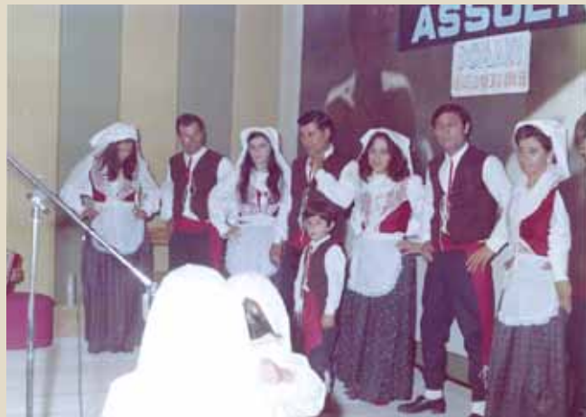
Uno dei primi gruppi folkloristici del Cilento sorto ad Ascea Marina