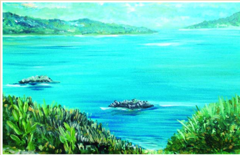
La foto riproduce un quadro del pittore Pietro Di Donato che raffigura un angolo della costa cilentana

Napoli non sia irrimediabilmente segnata. La città ha superato nei secoli carestie, pestilenze, terremoti, guerre e si è sempre rialzata con la disperazione tipica di una popolazione che deve contare solo su se stessa ed ha in sé una grandissima carica di sopravvivenza.