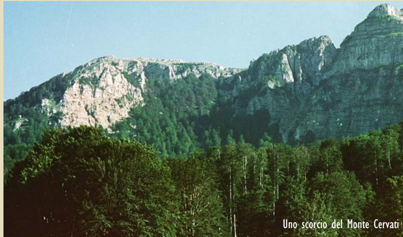
Uno scorcio del Monte Cervati

sci sulle montagna cilentane...perchè si è capito che solo attraverso passi concreti veri si può creare un turismo nell'entroterra da utilizzare come attrattore sia durante l'inverno che l'estate, l'idea è nata dal basso perchè oggi si è stanchi di un politica inesistente per l'entroterra dove ogni anno i paesi diventano sempre più ombre di se stessi, è una notizia di questo periodo che a Piaggine la Comunità montana dell'Alto Calore è stata costretta a disboscare e vendere il bosco di faggeti per mancanza di