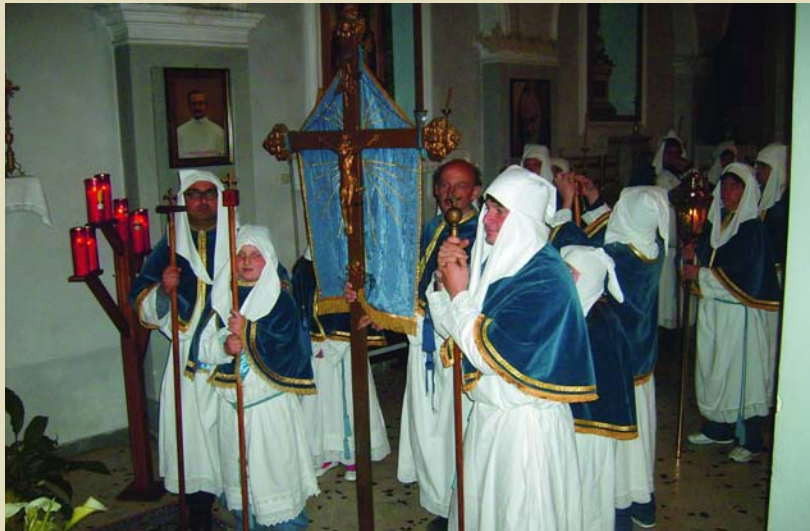
Una confraternita in pellegrinaggio nello scorso Venerdì Santo (Maria SS. del Soccorso di Cannicchio)

Il Papa invita a considerare le due grandi dimensioni della vita cristiana promosse dalle Confraternite: a) un adeguato cammino spirituale b) l'impegno nella Chiesa e nella società come espressione dell'amore a Dio e al prossimo. Nel cammino spirituale il Papa indica tre momenti qualificanti: a) la preghiera personale (ricordiamo come negli statuti di molte confraternite era prevista la preghiera dell'ufficio, in modo particolare quello della Madonna e dei defunti); b) l'ascolto della Parola di Dio (il mutato